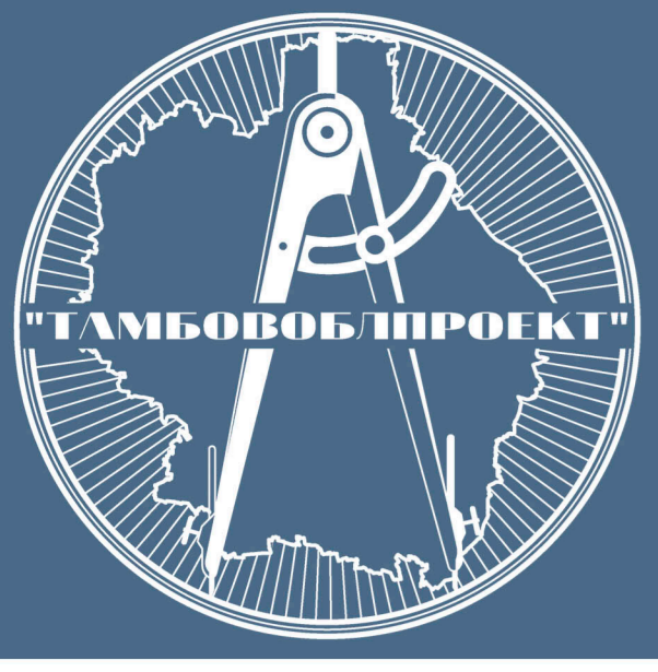
Схема территориального планирования муниципального образования - Сосновский район Тамбовской области

Карта объектов капитального строительства, иных объектов